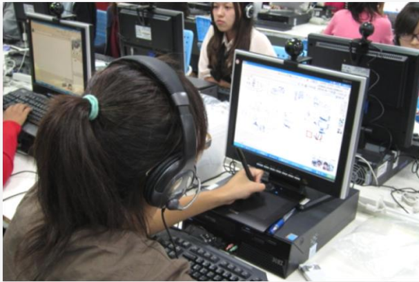
輔仁大學100-2學期遠距課輔教師系所分布